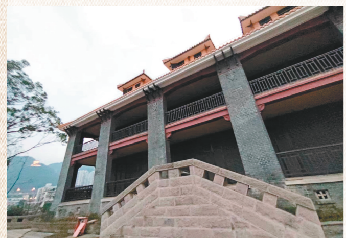
修缮后的亚细亚火油公司