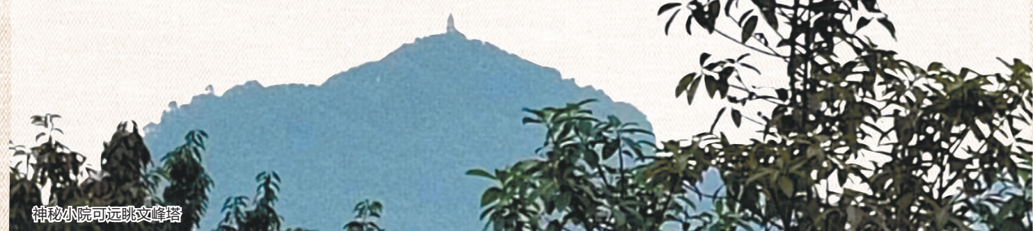
神秘小院可远眺文峰塔