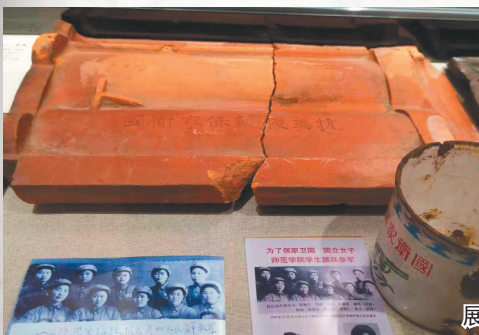
展厅中的两块瓦，看着普普通通，却有“保家卫国”之心。

郑老师指着一个玻璃展柜中的展品说：“大家看，这两块普通的瓦片，已经70多年了。瓦片一青一红，为我们留下了一段难忘的历史：因为每块瓦片上都印刻着‘抗美援朝 保家卫国’八个大字，历史气息扑面而来。”