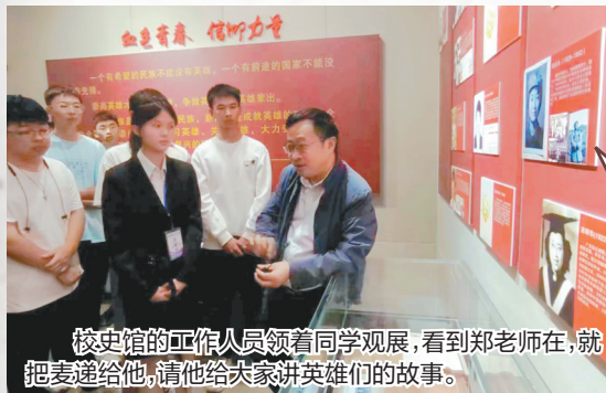
校史馆的工作人员领着同学观展，看到郑老师在，就把麦递给他，请他给大家讲英雄们的故事。