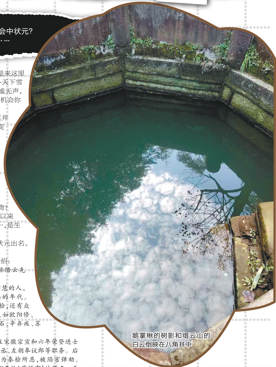
鹅掌楸的树影和缙云山的白云倒映在八角井中

860年后，有幸听闻“古城侯”那么多的故事。不知年少在缙云读书时的冯时行，还是回乡培养人才的冯时行，是否用了八角井的水研墨、洗砚？我们如今用井水洗砚是不是真能中状元？他的精神，如同缙云的风云，已经留在古井中。