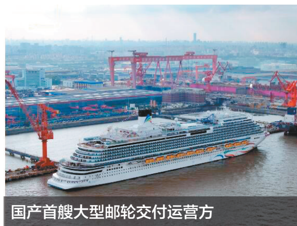
国产首艘大型邮轮交付运营方