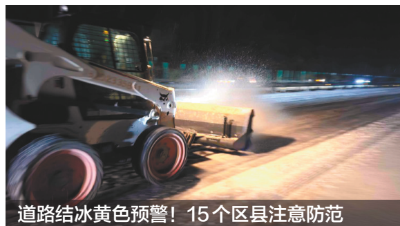
道路结冰黄色预警！15个区县注意防范

2月4日14时20分，重庆市气象台继续发布“道路结冰黄色预警信号”，受积雪影响，预计2月4日14时至5日20时，多地将出现对交通有影响的道路结冰。