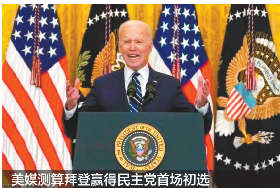
美媒测算拜登赢得民主党首场初选

据美国多家主流媒体测算和报道，现任美国总统拜登在当地时间3日举行的美国2024年总统选举南卡罗来纳州民主党初选中胜出。南卡罗来纳州初选是2024年美国大选民主党内首场正式初选。