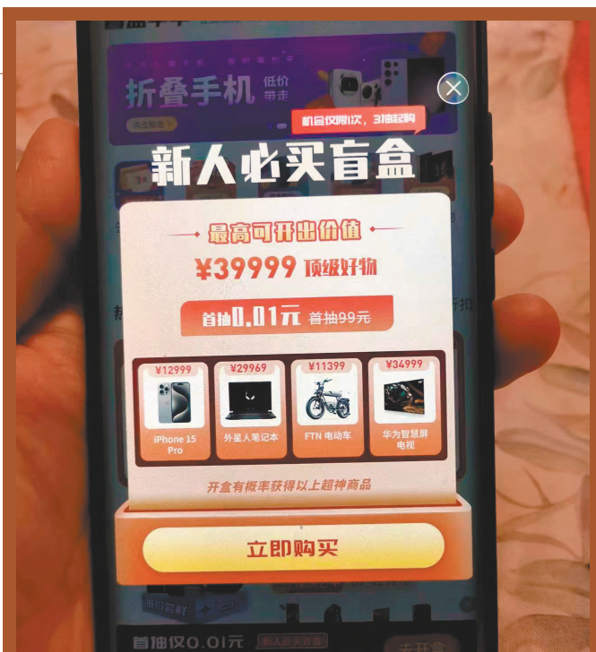
软件首页的提示抓眼球