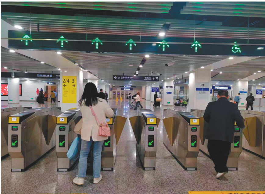
在轨道交通重庆北站南广场站厅，从标有2/4和3号出入口的一排闸机处刷卡出站直达铁路进站口。

春运还在继续，轨道交通重庆北站南广场站是许多人回家和返程的中转站，由于它是多条轨道交通线路的交汇点，因此可能会让一些初次来到这里的乘客感到有些“蒙圈”。那么，如何在重庆北站南广场站实现轨道交通、铁路、公交三网换乘高效、便捷、不迷路？来看看这份乘车攻略。