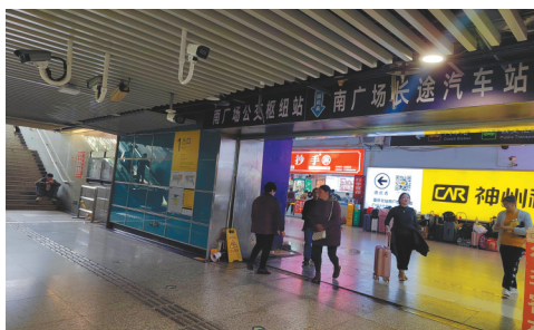
轨道交通重庆北站南广场站1号出入口紧邻公交站和长途汽车站