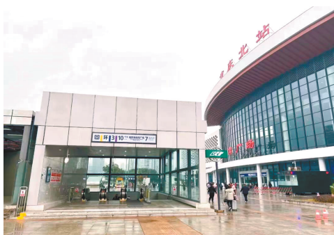
轨道交通重庆北站南广场站7号出入口