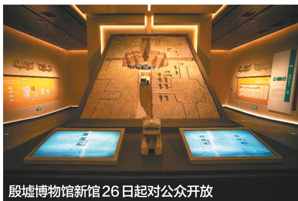
殷墟博物馆新馆26日起对公众开放

日前，国家文物局在京召开新闻发布会，宣布殷墟博物馆新馆将于2月26日对公众开放。展出青铜器、陶器、玉器、甲骨等文物近4000件套，展陈文物数量庞大、类型多样，其中四分之三以上的珍贵文物属于首次亮相。新馆坐落于洹水之滨，与殷墟宗庙宫殿区隔河相望，是首个全景式展现商文明的国家重大考古专题博物馆。