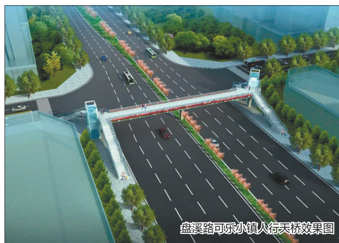
盘溪路可乐小镇人行天桥效果图