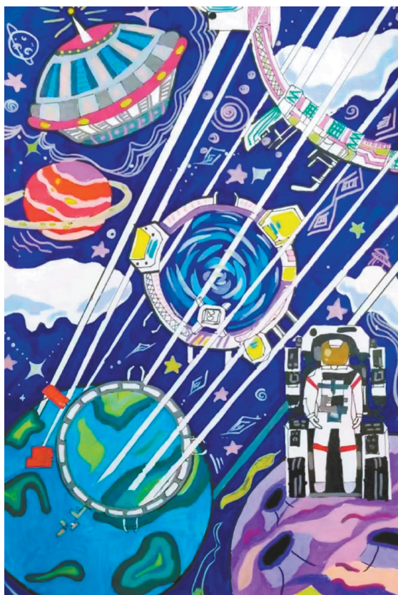
灵感来源于科幻电影

画展作品来自全国31个省、自治区、直辖市,以及香港澳门小画家之手,以“孩子眼中的中国式现代化”为主题,获奖的画作设计制作于空间站的两幅丝绸画卷之上,充分展现现代科技与传统文化的融合之美,使画展更具中国特色和文化韵味。