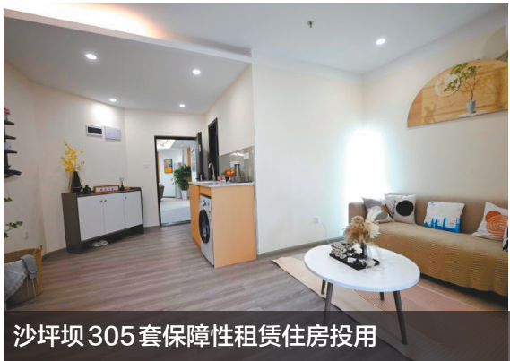
沙坪坝305套保障性租赁住房投用

记者从重庆市住房城乡建委获悉，4月8日，沙坪坝区首个非住宅类保障性租赁住房项目——CCB建融家园·小龙坎人才公寓项目正式投用，市民申请后可拎包入住。