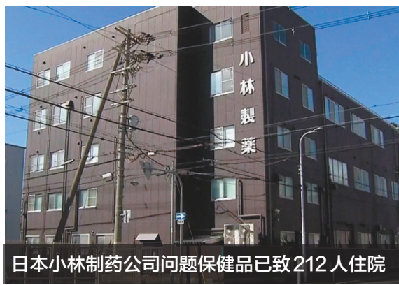
日本小林制药公司问题保健品已致212人住院

据朝日电视台当地时间4月8日报道，截至当天，服用小林制药含红曲成分问题保健品的消费者中，已有212人住院治疗，相关咨询达53000件。