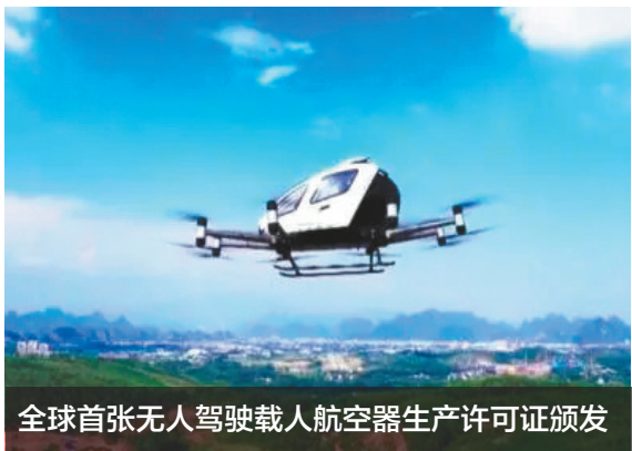
全球首张无人驾驶载人航空器生产许可证颁发

4月7日，中国民航局在广东广州正式颁发首张无人驾驶载人航空器生产许可证，这是全球电动垂直起降飞行器行业内首张生产许可证。