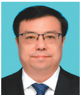
王进军,1969年8月出生,研究生,理学博士,中共党员,教授。曾任西南大学党委常委、副校长。