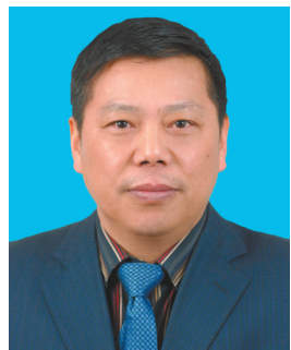
张卫国,1965年6月出生,研究生,管理学博士,中共党员,教授。曾任西南大学校长、党委副书记。

4月18日,教育部人事司在西南大学宣布了教育部党组的任免决定,张卫国同志由西南大学校长转任党委书记,王进军同志任西南大学校长、党委副书记,李旭锋同志不再担任西南大学党委书记职务。