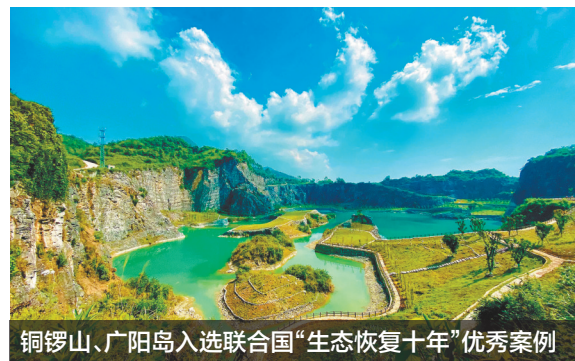
铜锣山、广阳岛入选联合国“生态恢复十年”优秀案例

4月18日,来自重庆市规划和自然资源局的消息,重庆铜锣山矿区生态修复项目、广阳岛生态修复项目入选联合国“生态恢复十年”优秀案例,目前正在联合国相关官方网站中进行在线展示。