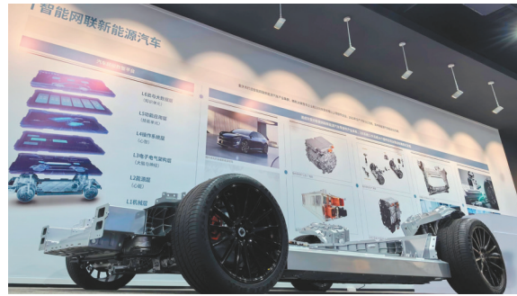
重庆科技创新和产业发展成果展示

4月24日上午,总书记在听取重庆市委、市政府工作汇报时指出:重庆制造业基础较好,科教人才资源丰富,要着力构建以先进制造业为骨干的现代化产业体系。从深入实施制造业重大技术改造升级和大规模设备更新工程,到加强重大科技攻关,总书记作出明确指导。