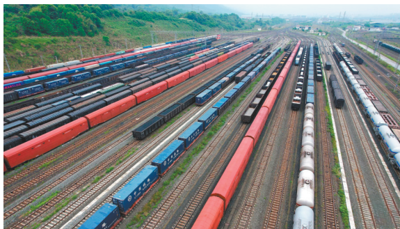
重庆国际物流枢纽园区

两个月时间里,总书记在重要会议上和考察途中,两次强调物流是实体经济的“筋络”,既体现了对实体经济的重视,又彰显了物流的重要价值。我们要坚持把发展经济的着力点放在实体经济上,同时要建设高效顺畅的流通体系,以“筋络”之活促“身体”之健。