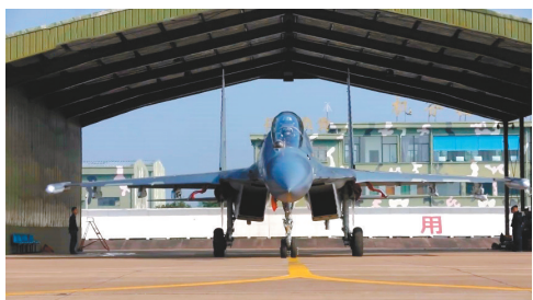
东部战区空军出动数十架次战机成体系实施环台岛战巡、绕外岛巡航。