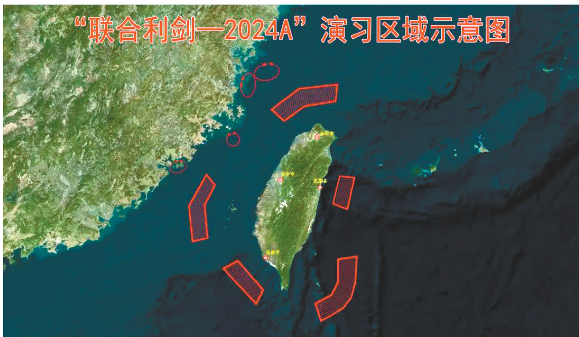
“联合利剑-2024A”演习区域示意图