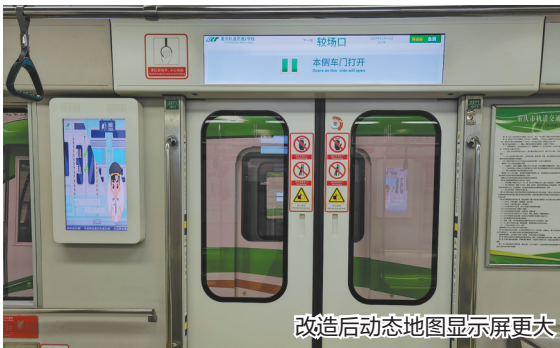
改造后动态地图显示屏更大