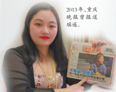
2013年,重庆晚报曾报道遥遥。