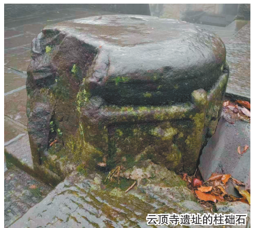
云顶寺遗址的柱础石