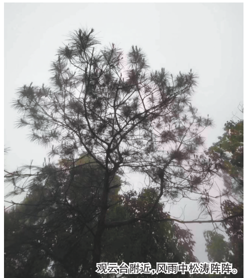
观云台附近，风雨中松涛阵阵。