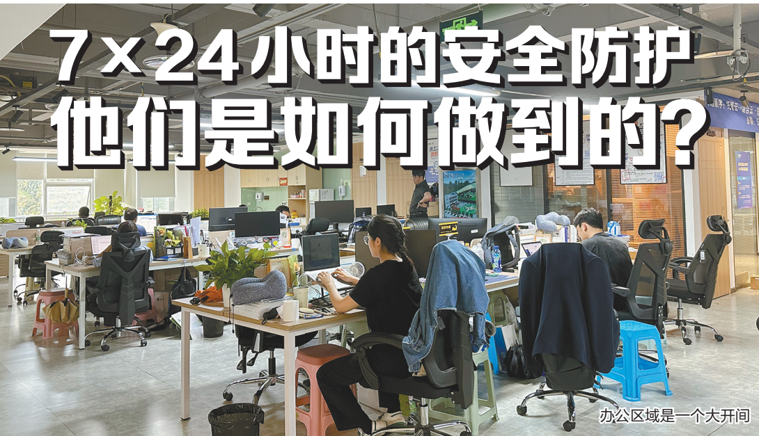
办公区域是一个大开间

一提到节假日值班，公司IT兼职安全运维人员准是头疼，“选择了这份工作，好像所有的节假日都与我无关！”