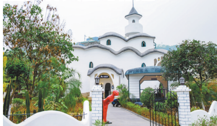
重庆晚报通讯员 杨孝永

位于涪陵区蔺市镇梨香溪西岸,居于长江之滨,与蔺市古镇、梨香溪为邻的美心红酒小镇古堡民宿,距重庆中心城区约60公里,是一座以“闻名君子镇,浪漫梨香溪”为主题的旅游景区。每个房间都以童话中的主人公命名,房间内的布置也各具特色,有复古风、洞穴风等不同风格,等待游客到来。