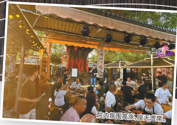
院内氛围高涨,座无虚席。