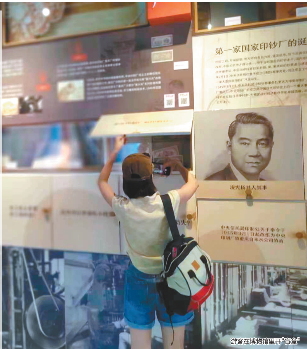
游客在博物馆里开“盲盒”