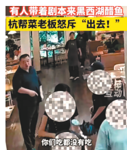
有人带着本来黑西湖醋鱼 杭帮菜老板怒斥“出去!”

近来,在多个短视频平台上,调侃西湖醋鱼正成为某种流量密码。在某短视频平台上搜索“西湖醋鱼”,前三的点赞量均超过45万,标题大致为“粉丝推荐去吃西湖醋鱼,感觉被骗了”。此外,类似“一条鱼被做成西湖醋鱼,那条鱼就白死了”等玩梗也是层出不穷。