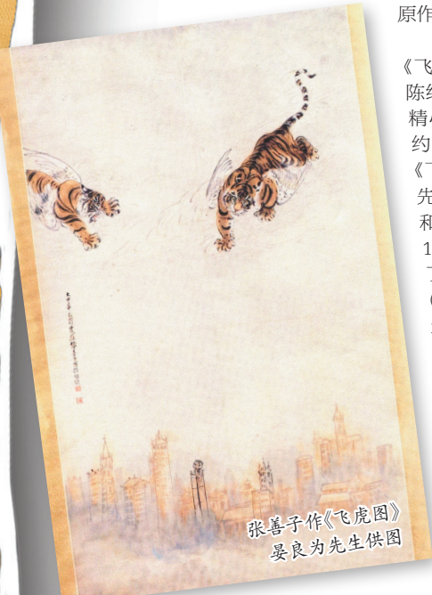
张善子作《飞虎图》

据张善子外孙晏良为透露,“那幅《飞虎图》,是1940年4月初,外公获知陈纳德先生将组建AVG,援华抗日,就精心绘制了长着双翅的猛虎飞翔于纽约上空,钤印:大风堂,善子。然后将《飞虎图》赠送给陈纳德先生。陈纳德先生非常喜欢这幅画,常向亲朋好友和战友展示这幅画。还将1941年8月1日在中国云南昆明组建的AVG取了另外一个昵称——Flying Tigers(译:飞虎队)。后来,迪士尼公司的卡通设计师根据这幅画设计了飞虎队的队徽。其实,后来外公还绘制了另外一幅同样画面的《飞虎图》,供抗日募捐巡回展之用。1988年9月,收藏家樊建川先生在成都翰雅拍卖会上买到了这幅画,并藏于成都市大邑县安仁镇的建川博物馆。2011年6月4日,哥哥晏良里带着我们兄妹和外甥张楠数人前去拜访樊建川先生,看到了外公的那幅《飞虎图》,非常感慨……”