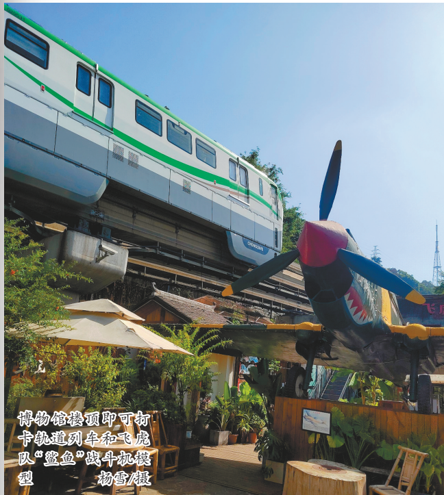
博物馆楼顶即可打卡轨道列车和飞虎队“鲨鱼”战斗机模型

据现场工作人员程革介绍,2003年,博物馆正式注册成立,当时名为重庆飞虎队展览馆。2017年,更名为重庆渝中区友好飞虎队博物馆。