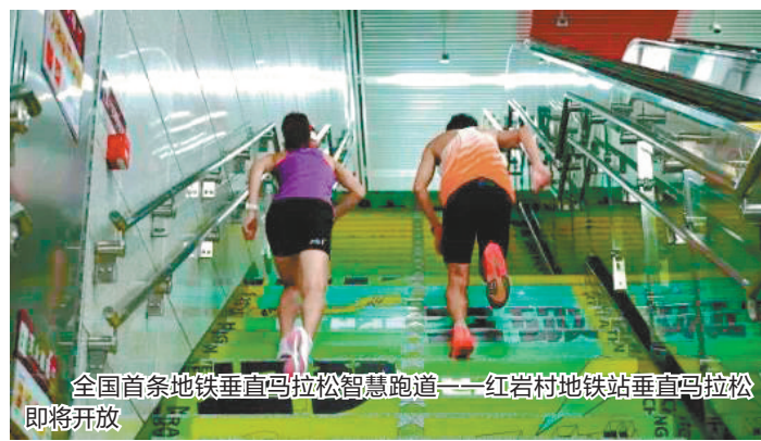
全国首条地铁垂直马拉松智慧跑道——红岩村地铁站垂直马拉松即将开放