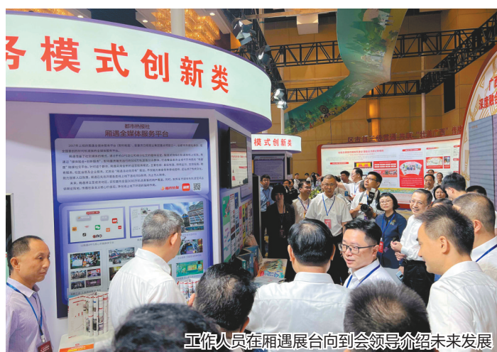
工作人员在相遇展台向到会领导介绍未来发展

据介绍,“相遇”会打通从传播营销到终端旅游消费的全链条,创造新消费场景、培育新消费需求、形成新消费习惯、打造新旅游品牌。具体来说,以新开发的“相遇”小程序上线为契机,以培育重庆轨道交通2号线全域旅游示范线为抓手,以打造红岩村地铁站垂直马拉松等现象级IP为爆点,引导海内外游客“寻找李子坝的下一站”,到全国熊猫最多的动物园“实现熊猫自由”,着力培育以轨道交通、城际铁路等为载体的重庆全域旅游新名片。串点成线、联线成片,着力培育以轨道交通为载体的重庆全域旅游新名片。