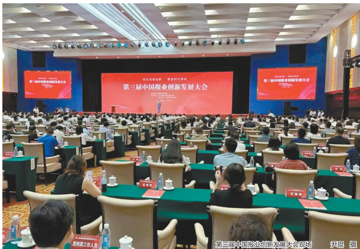
第三届中国报业创新发展大会现场

9月2日,由国家新闻出版署主办的第三届中国报业创新发展大会在南宁召开。大会同期举办了“2024年中国报业创新发展案例展”,并向获奖的相遇全媒体服务平台等60个案例颁发证书。