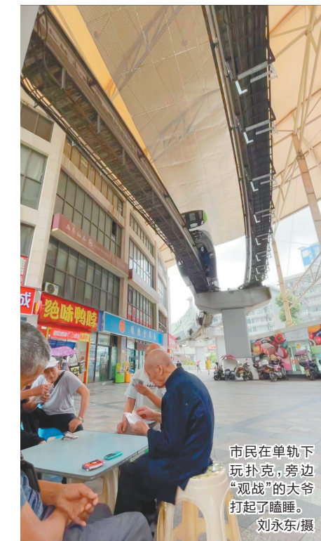
市民在单轨下玩扑克,旁边“观战”的大爷打起了瞌睡。