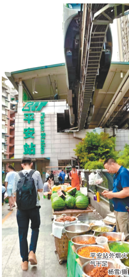
平安站外烟火气十足