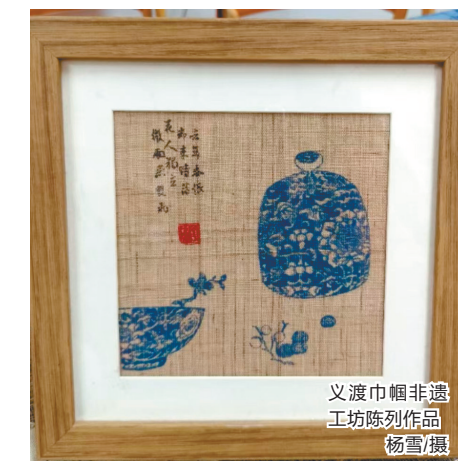
义渡巾帼非遗工坊陈列作品