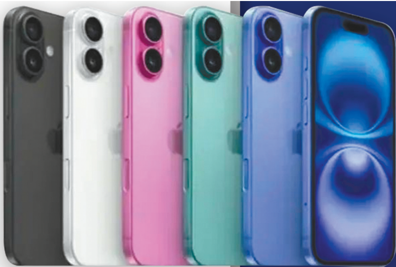
iPhone 16 系列